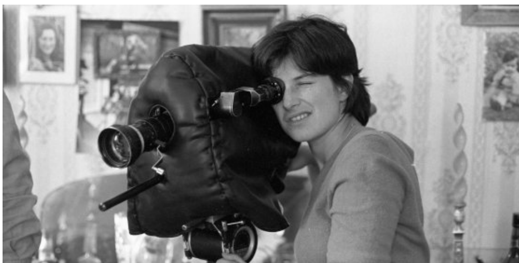
FILM WOMEN MAKE FILM