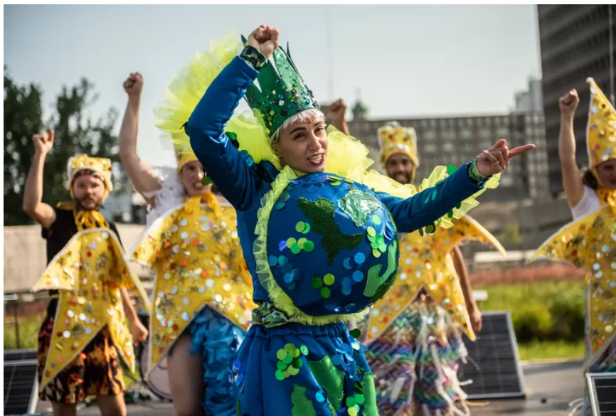
Antropoceen, de musical

Het Rotterdamse performancecollectief Club Gewalt maakte een experimentele musical over de klimaatcrisis. Alstublieft, stop nu niet meteen met lezen. Ook al heeft een woord als klimaatcrisis wellicht die uitwerking op u. Dat is heel begrijpelijk. Dat hadden de leden van Club Gewalt, naar eigen zeggen ‘8 millennials gefascineerd door popcultuur’, precies zo.