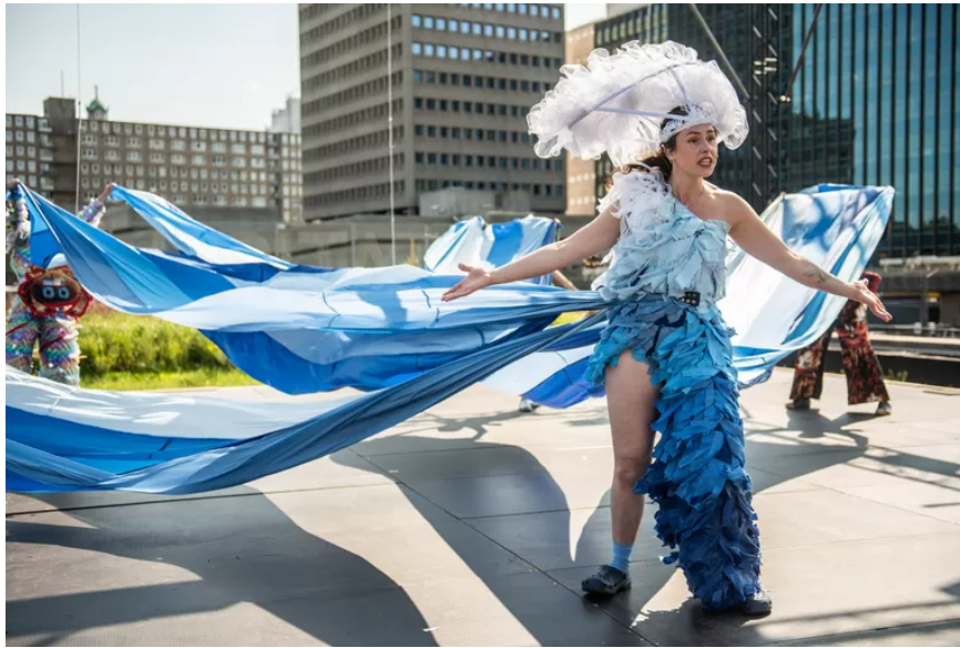
Antropoceen, de musical Beeld Bart Grietens