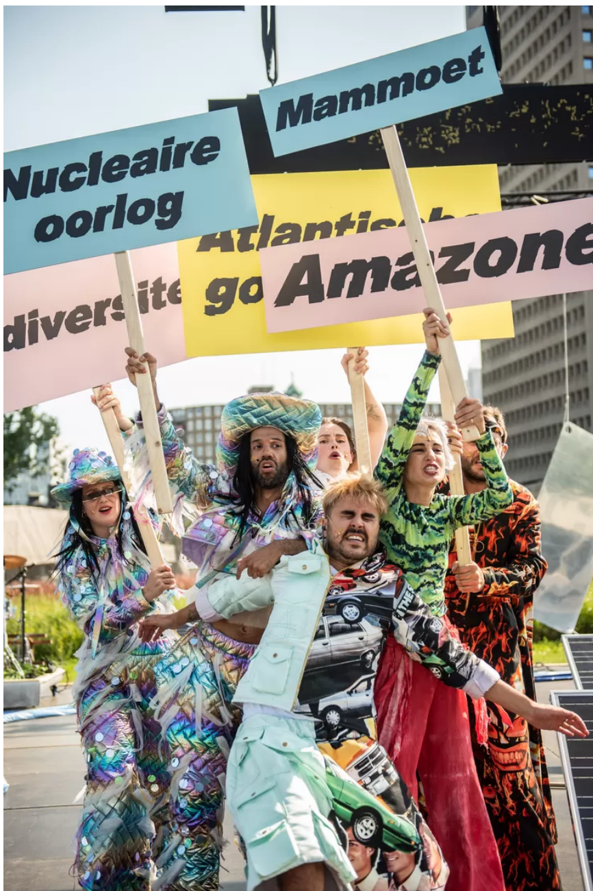
Scene uit Antropoceen, de musical